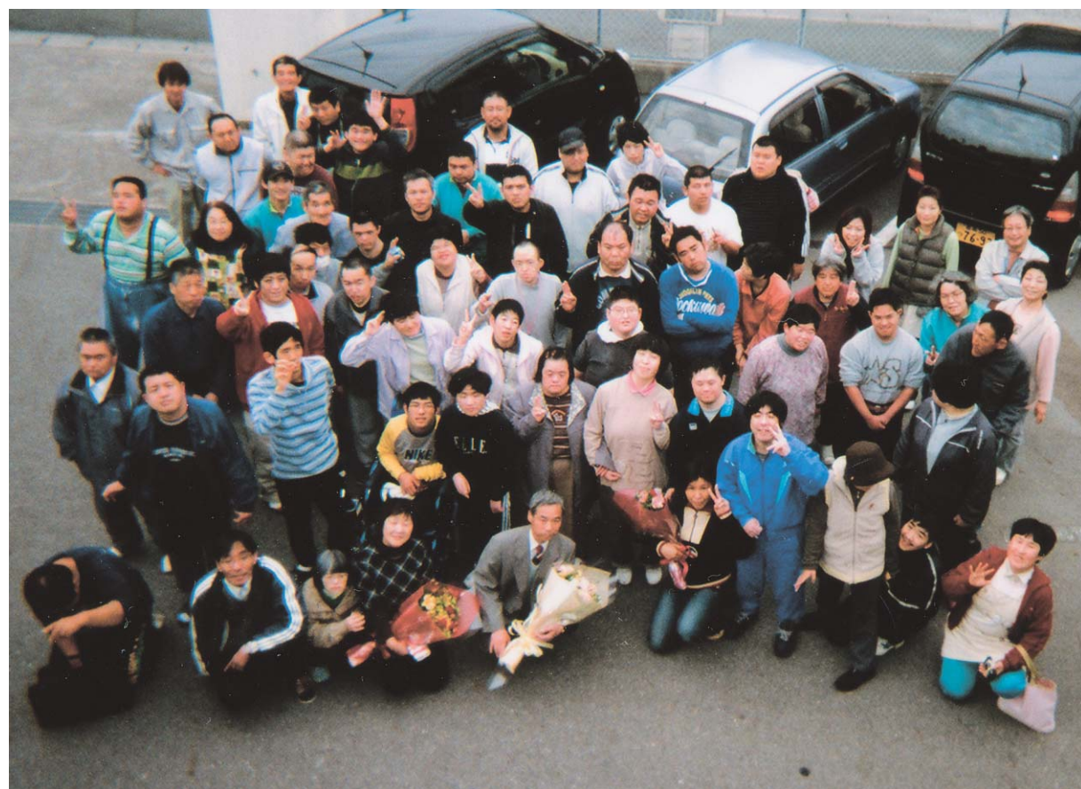
●飛翔(新しい世界へはばたく)