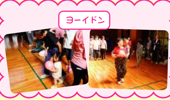
つぎの次の人へバトンタッチ