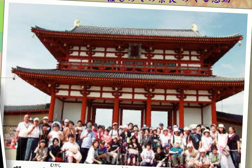
ずーっと昔、まだクレーン車もない頃に、人間の力でこんなに大きな建物を建てたことに、感動！