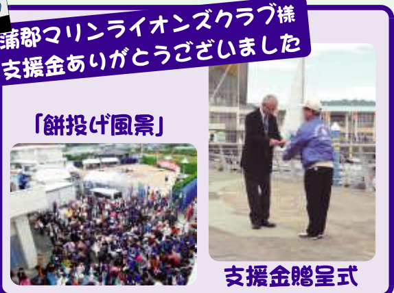
蒲郡マリライオンズクラブ様 支援金ありがとうございました