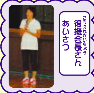
後援会の方のダンス