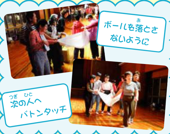
ボールを落とさないように