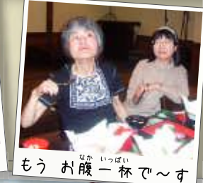
もうお腹一杯で～す