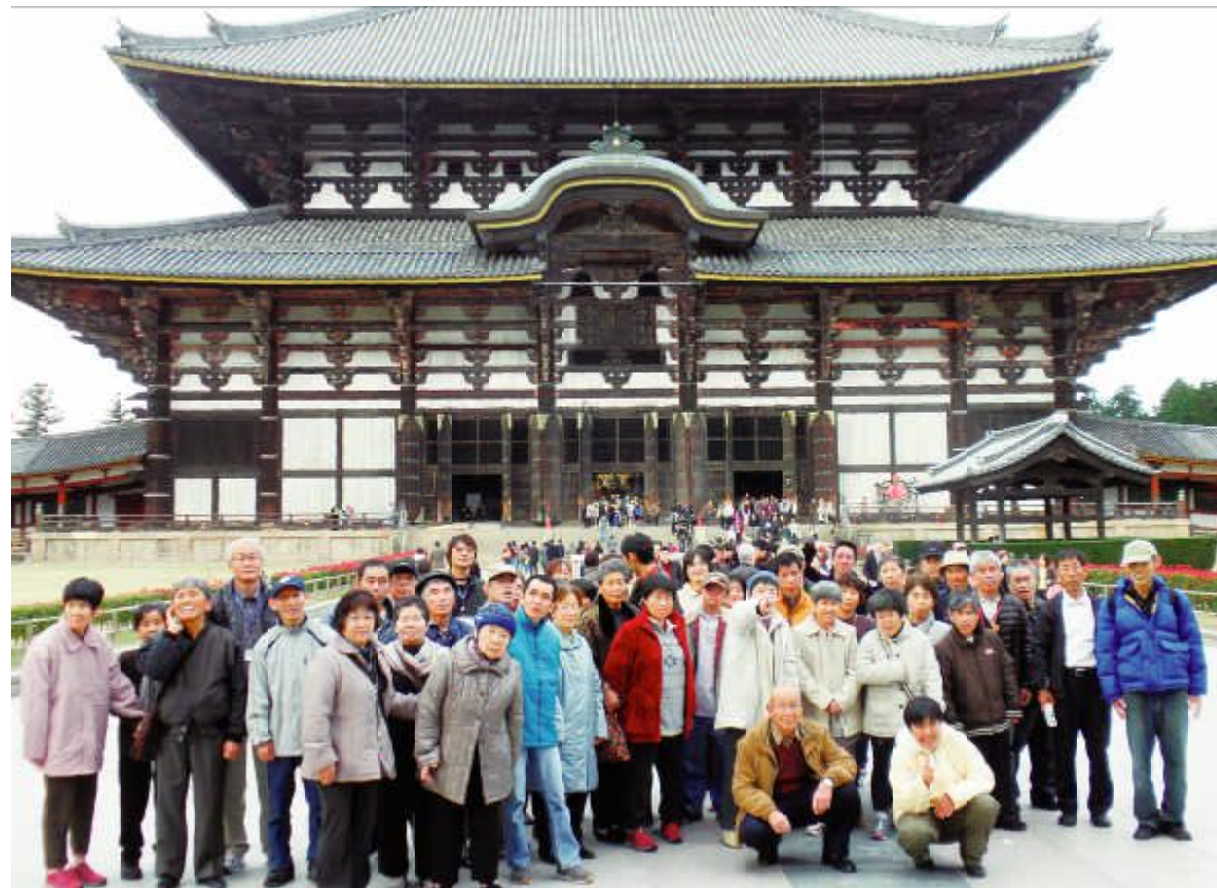
●親子旅行 東大寺にて