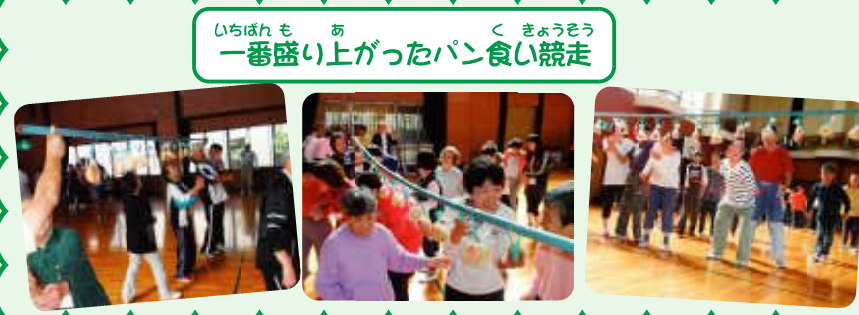
いちばんもあ 一番盛り上がったパン食い競争