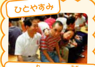
ひとやあみ みんな輪になって踊ろう