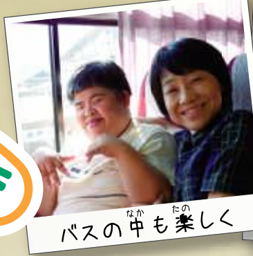
バスの中も楽しく