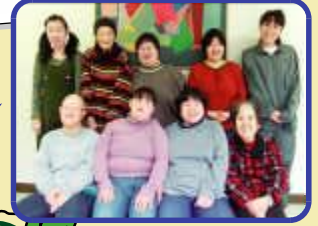
おしゃべり大好き♡ 仲よしメンバーで～す

多種多様の作業を、9名のメンバーで、各個性に合わせて、作業を分担・頑張っています。