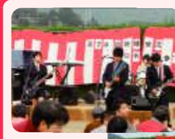
アドラウダンス出演者