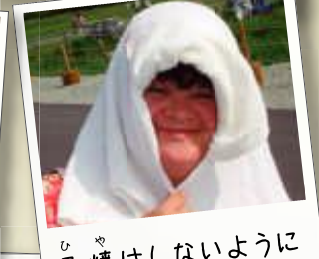
日焼けしないように