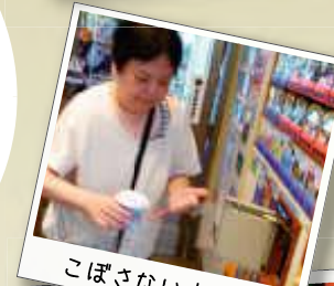
こぼさないように