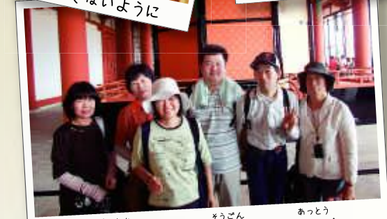
天井高く、その荘厳さに圧倒