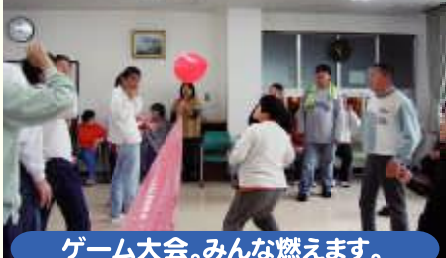
ゲーム大会。みんな燃えます。

「クラブ活動」「ゲーム大会」「ドライブ」散歩「誕生者会」土曜日の作業はお休みです。仲間と楽しく過ごす時間です。