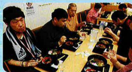
班ごとに好みのお店で昼食をいただきました。