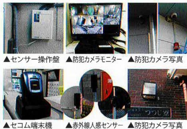
▲センサー操作盤 ▲防犯カメラモニター ▲防犯カメラ写真 ▲セコム端末機 ▲赤外線人感センサー ▲防犯カメラ写真

神奈川県相模原市にある障害者支援施設「津久井やまゆり園」の事件を受けて、外部からの不審者対応として、防犯カメラと赤外線センサーの増設や、警備会社端末機の導入などの防犯対策を強化しました。