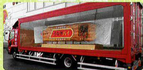
工場見学の記念に「うなぎパイ」をお土産にいただきました。