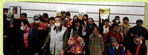
記念撮影の後はお待ちかねの昼食に向かいます。