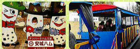
色んな工房もありました。施設内をメルヘン号で移動。