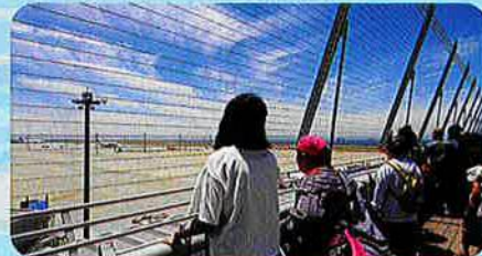
デッキからの眺めはサイコー!

6月9日(金)全体レクリエーションで中部国際空港(セントレア)に行ってきました。デッキから飛行機を見たり、班ごとに好きなお店に入っ