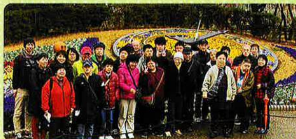
寒い季節でしたが、花が満開でした。