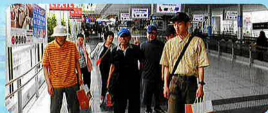
お土産もたくさん買って大満足!