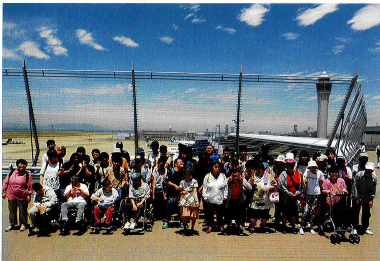
● わくわくワーク大塚 セントレアにて