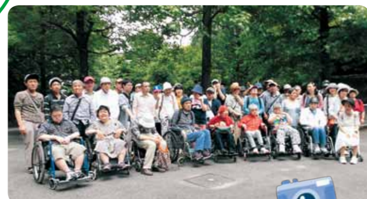
みんなでそろうて記念撮影!