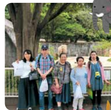
ステキなお土産も買いました。