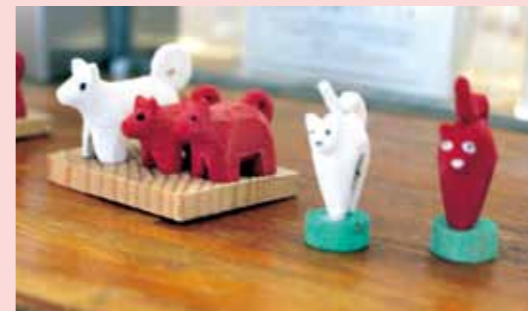
毎年手作りの干支の置き物をいただいています。今年には犬と猫の置き物です。いつもありがとうございます。