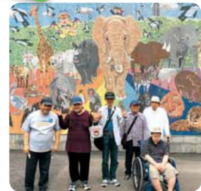
動物園の人気者がいっぱい。

平成30年5月17日(木)、利用者さん、職員で、全体レクリエーションとして名古屋にある東山動植物園へ行ってきました。少々蒸し暑い中、来場者も大勢で人気の高さを物語っていましたが、話題のゴリラやコアラも観覧でき楽しい一日となりました。