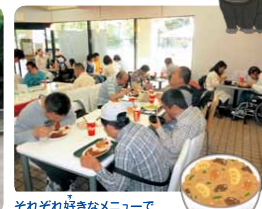
それぞれ好きなメニューで

「災害用資材保管庫」が配備される。 日本赤十字社による救護配備事業として平成29年12月に「災害用資材保管庫」が納入されました。今までも乾パンやアルファ米などの食料品やマルチ対応型トイレ、毛布、移動がまどやパーティションなどが配備されていましたが、それを保管する倉庫として役立てたいと思います。ありがとうございました。