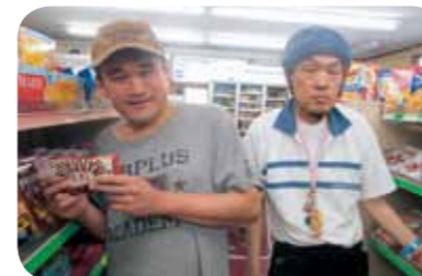
近隣商店に買い物