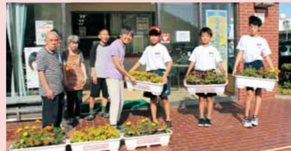
大塚小学校より生徒さんたちが育てたお花『人権の花』をいただきました。つつじ寮玄関で綺麗に咲いています。