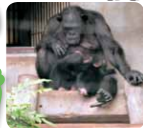
親子のゴリラも可愛いネ