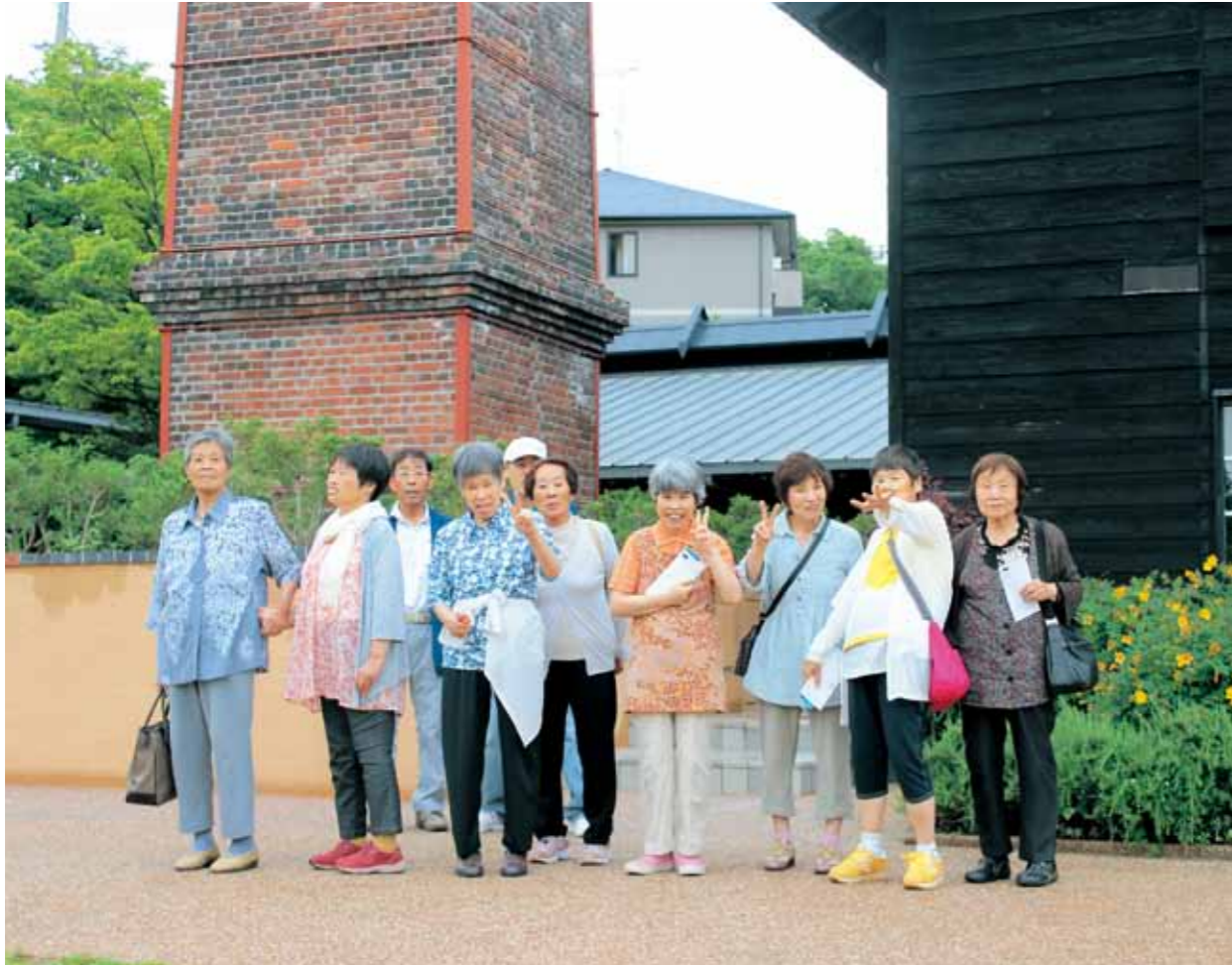
●つつじ寮ふれあい旅行(日帰り) INAXミュージアムにて