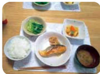
ある日の夕食メニュー