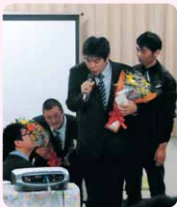
お父さん お母さんありがとう