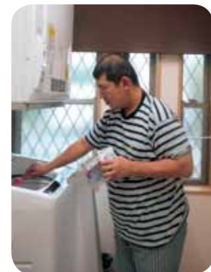
自分で洗濯します。