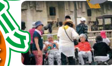
噂のシャバーニが!

平成30年5月17日(木)、利用者さん、職員で、全体レクリエーションとして名古屋にある東山動植物園へ行ってきました。少々蒸し暑い中、来場者も大勢で人気の高さを物語っていましたが、話題のゴリラやコアラも観覧でき楽しい一日となりました。