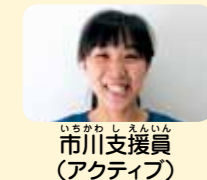
市川支援員 (アクティブ)