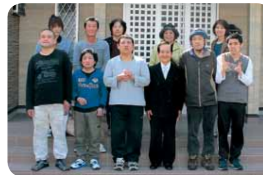
ふれんずの皆さん