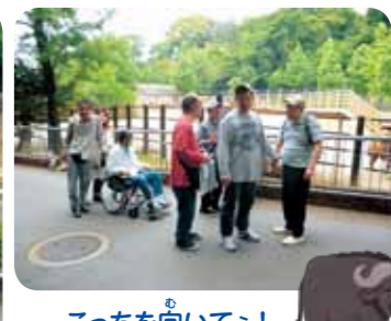
こっちを向いてえ!