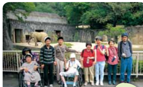
大きな象さんでした。