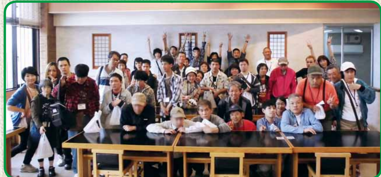
とても楽しかったよ〜♥