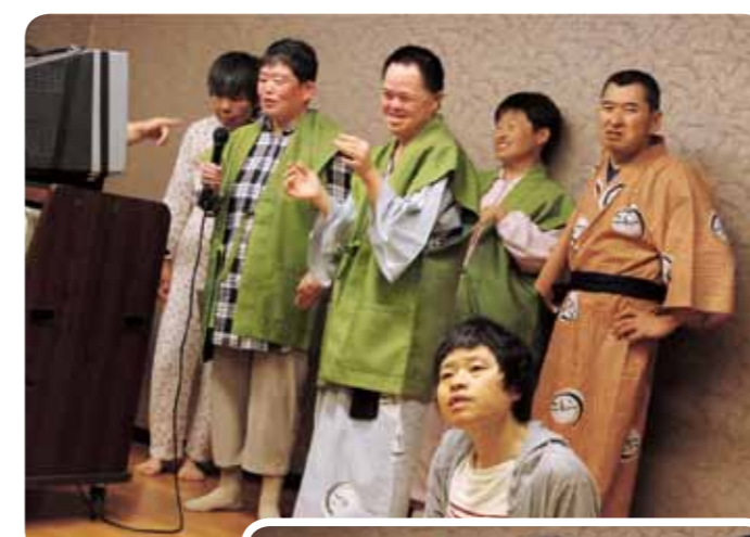
旅館での宴会は おおも 大盛り上がり♪