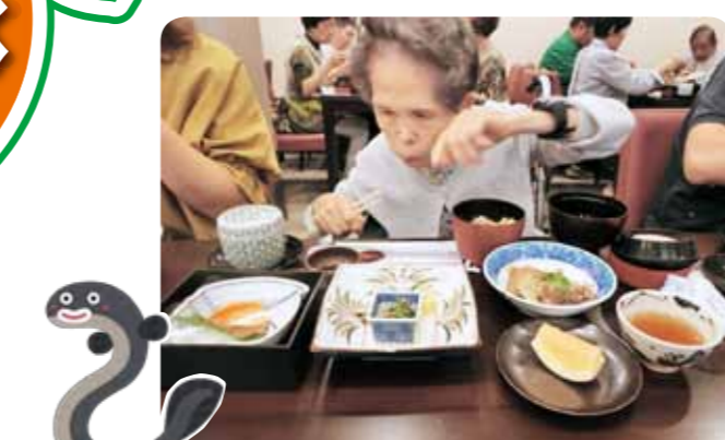
うなぎ美味しくいただきました