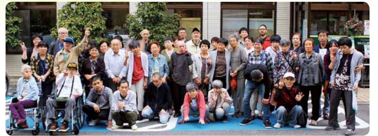
かんでんぱぱガーデンに到着！寒天を作る行程を見学したり、美味しい寒天を頂きました♪