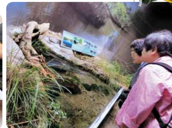
長良川を再現したのを楽しみました