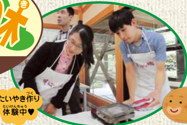
たきやき作り 体験中♥