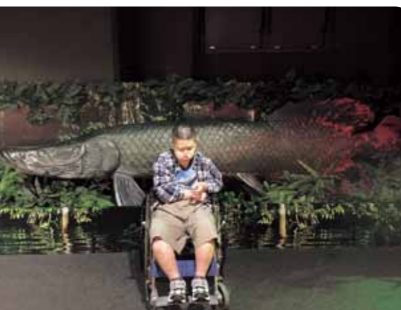
ピラルク大きかったです