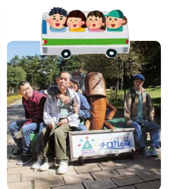
2日目、諏訪湖を見ながら移動した後、チロルの森にて機関車に乗ったり、射的をして楽しみました♪