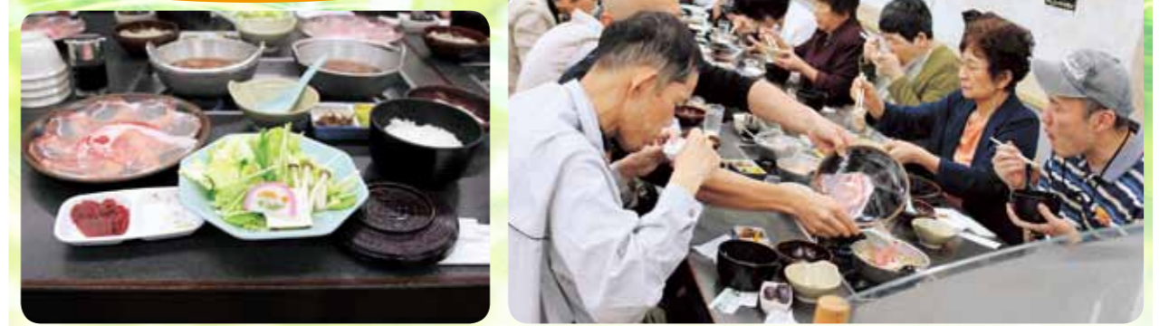
1日目、昼食は豚しゃぶです。美味しかったですね（^-^）