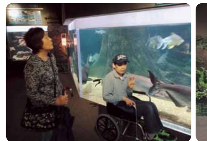
世界の淡水魚は優雅でした