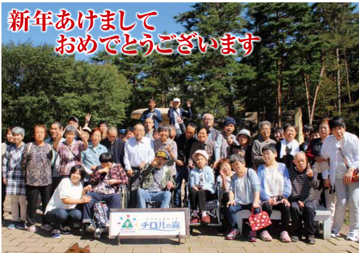
●つつじ寮 一泊ふれあい旅行 上諏訪チロルの森にて