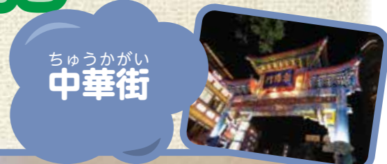
ちゅうかがい 中華街

今年の親子一泊旅行は横浜に行ってきました。 中華街、八景島シーパラダイスなど、楽しむことができました。