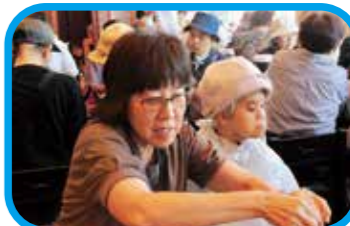
さて、どれから食べようかな？

二日目は沼津港にある沼津深海水族館で世界でも珍しい深海魚を見てきました。見たこともないような迫力のある姿で非常に面白かったです。二日目ということもあり疲れもあるかとも思いましたが、皆さん元気に楽しんでいました。おいしい昼食も食べ、つつじ寮に帰寮です。二日間、長いようで短かったですが、皆さんのご協力もあり無事に旅を終えることができました。今後ともつつじ寮をよろしくお願いいたします。