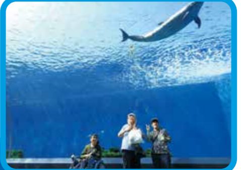
水族館楽しかったね♪