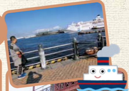
あか 赤レンガ そうこ 倉庫