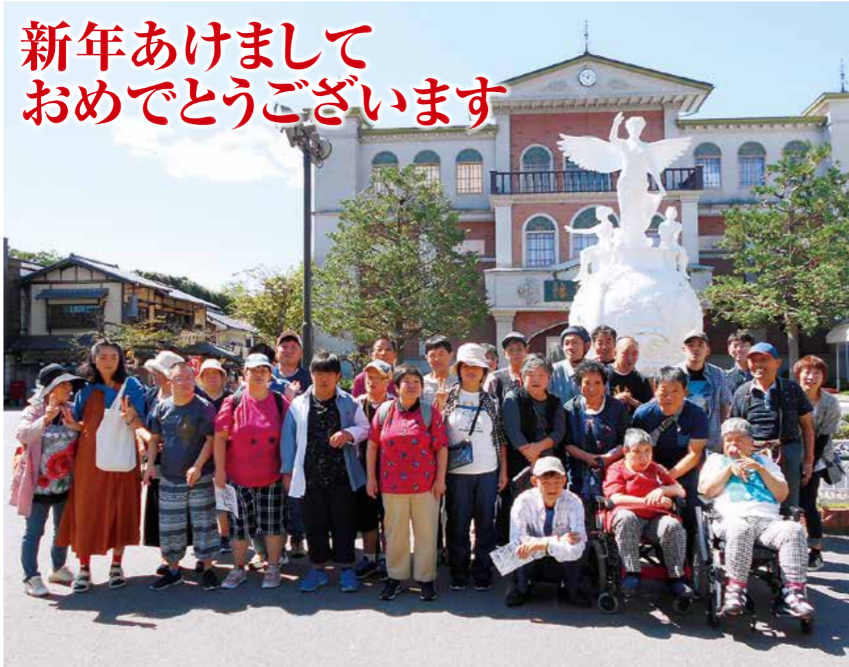
●わくわくワーク大塚 東映太秦映画村にて