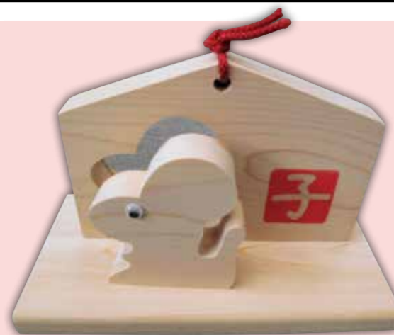
干支の始まりということでデザインを一新し、くりぬき型になりました。

子の年は、十二支の始まりで、増えるという意味合いがあり、命の誕生という意味があります。 個人としては、「自分の軸となる価値観を持つて進む」「組織としては、「新たな局面に対応できる人材の育成・活用に取り組み。」など今後のことを見据えて心がけると良い年です。 サポートくすの木は、どんな局面にも対応できるように取り組んでいきたいと思えます。