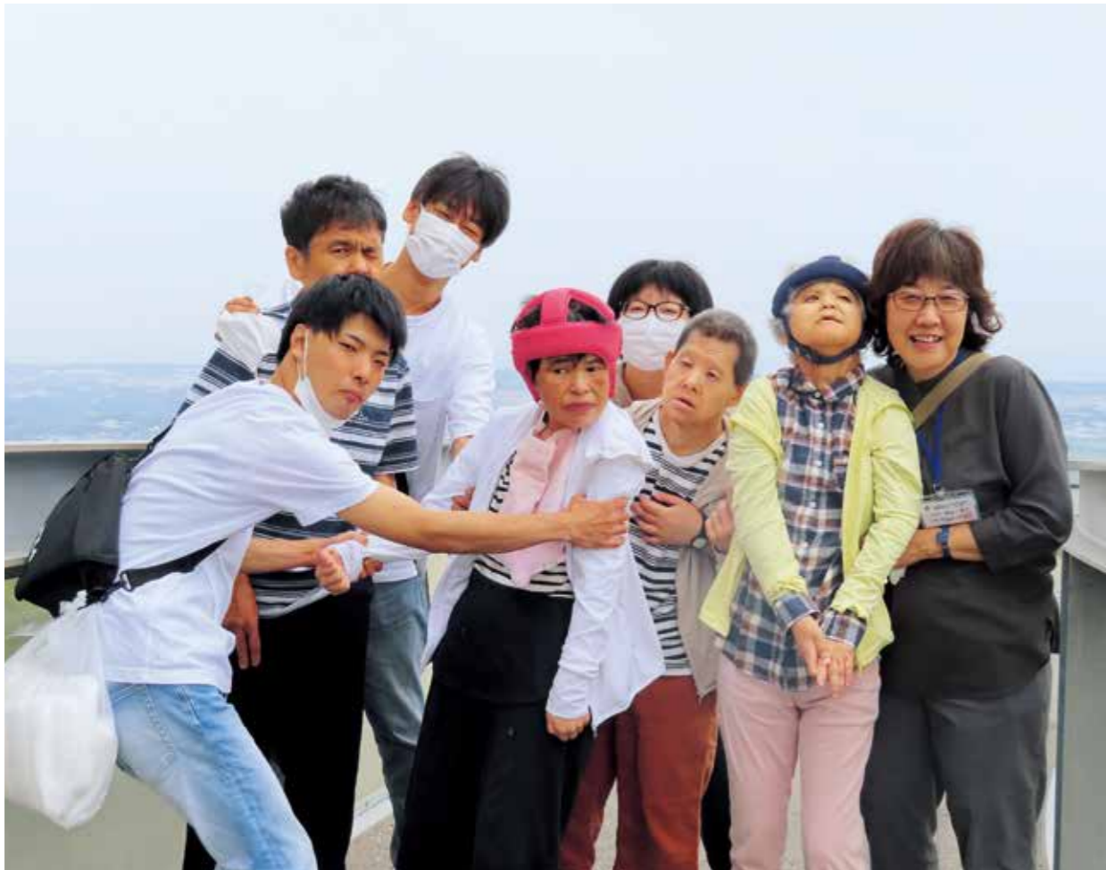
●久しぶりのおでかけです（蔵王山展望台・つつじ寮）