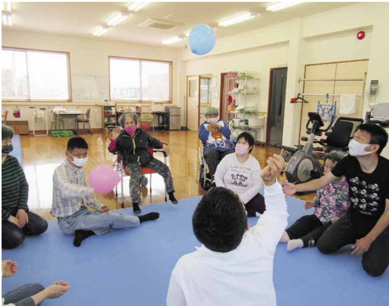
●クラブ活動のひととき（わくわくワーク大塚）