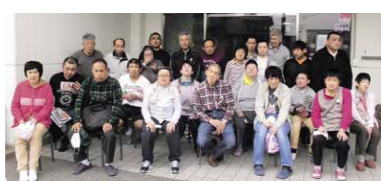
※撮影時のみマスクを外しています。

令和2年度皆勤賞 昨年度一度も休まずに出勤し、皆勤賞の表彰を受けたのは、24名の利用者の方でした。新型コロナウイルスが心配される中、ほぼ半数の利用者の方が皆勤賞でした。また、数名は1日、2日休んだだけで皆勤賞には届かずとも残念でした。賞状と記念品を贈呈しました。