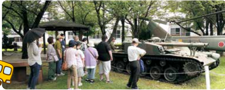
じえいたい せんしほ 自衛隊 じえいたい の戦車 せんしほ がかっこいいな～