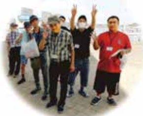
ラグーナでピース

れい わ 令 れい 和 わ 5 年 ねん 度 ど 自 じ 治 ち 会 かい 役 やく 員 いん