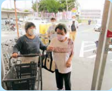
買い物で材料選び