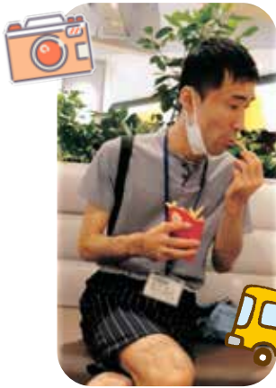
ポテトおいしいな～