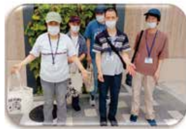
みんなで はいチーズ!