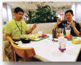
ひさ 久 ひさ しぶりの外 がい 食 しょく うれいしな