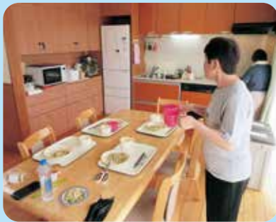
盛り付け、配膳も自分達で