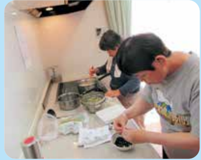
材料のカットも味付けも手際よく♪