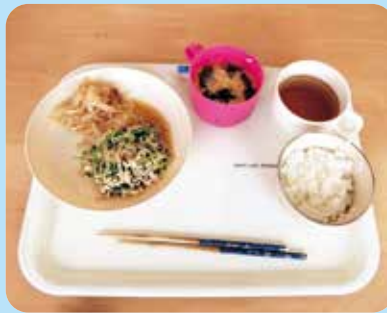
完成。今日のメニューはご飯、玉子スープ、おかずナムル、玉葱ソテー