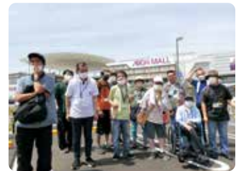
イオンモ-ル豊 とよ 川 かわ に行 い ってき ま しました!