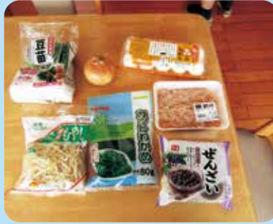
何ができるのかな？