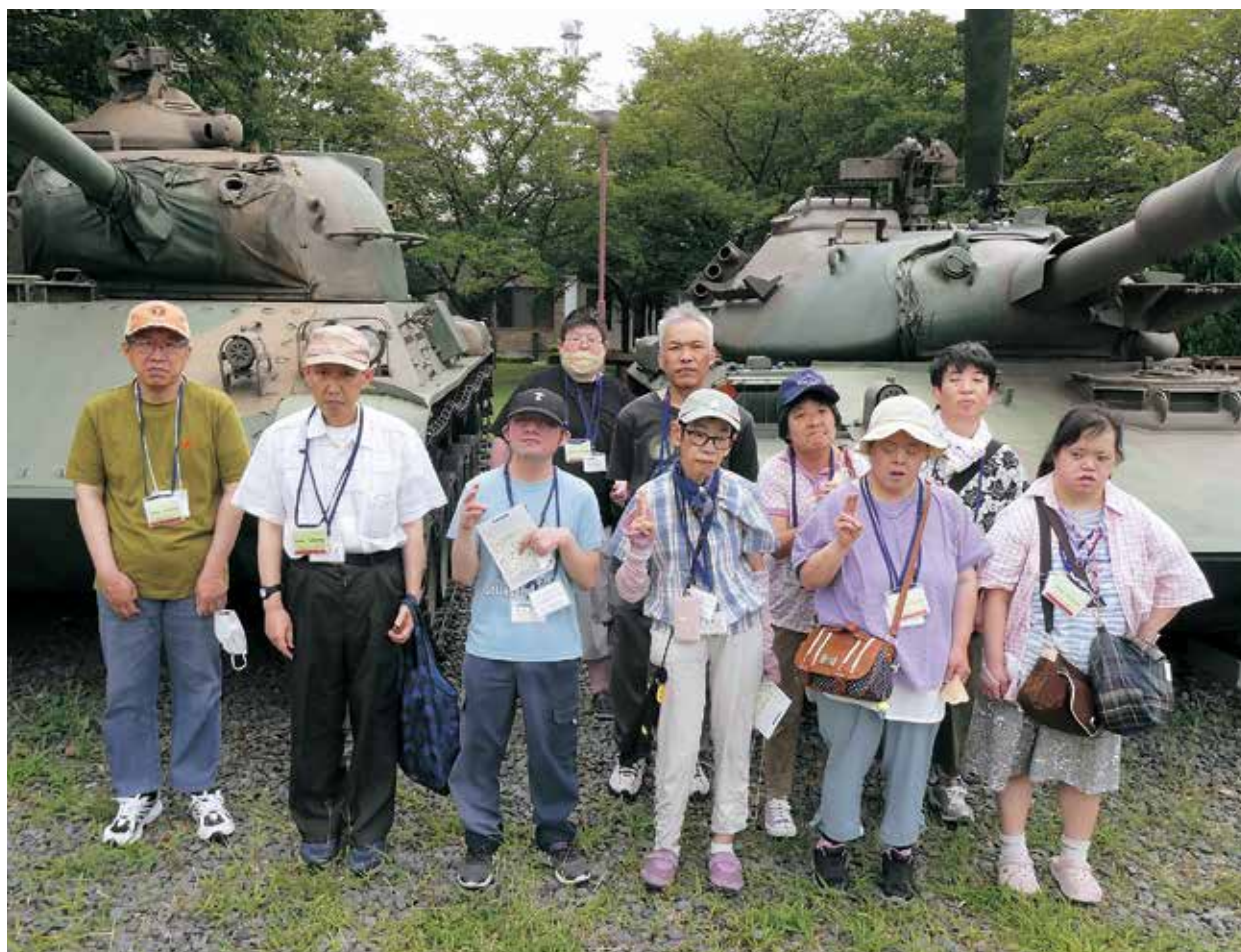
●サポートくすの木 選択レク 陸上自衛隊（豊川駐屯地にて）