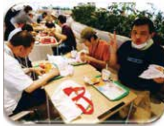
がいしほつ 外出 がいしほつ といったらハンバーガーだよね

かくか ねん せんたく でか 各課4年ぶりとなる選 せん 択 たく レクに出 で 掛 か けてきました。