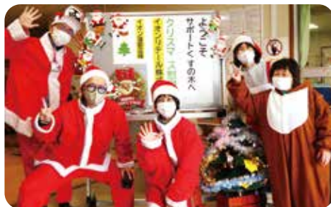
イオン蒲郡店のサンタクロースの皆様