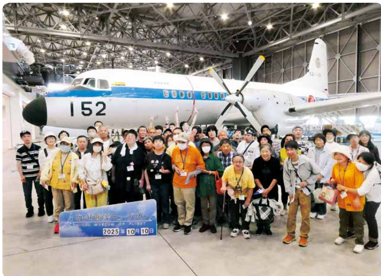
サポートくすの木 親子日帰り旅行（あいち航空ミュージアムにて）