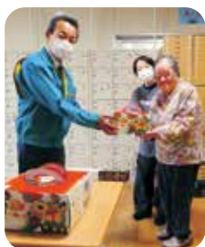
光田屋 株式会社 様